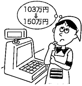
(図表1) 配偶者控除額