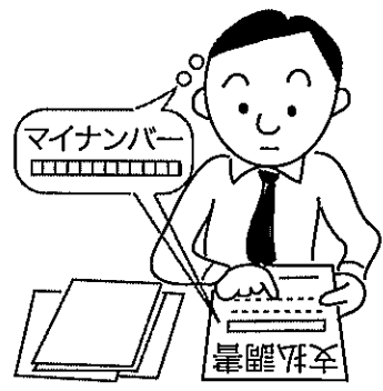
【給与所得の源泉徴収票の提出範囲】

(1) 提出義務者 平成二十八年中に不動産、不動産の上に存する権利、総トン数二〇トン以上の船舶・航空機の借受けの対価等を支払った法