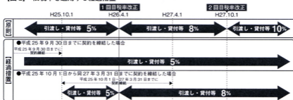
【図2】 旧税率を適用する経過措置

② 財務会計等のシステム対応の確認 税率の改正日を跨ぐ事業年度では、複数の税率が混在します。財務会計等のシステムが対応できるか確認しておく必要があります。